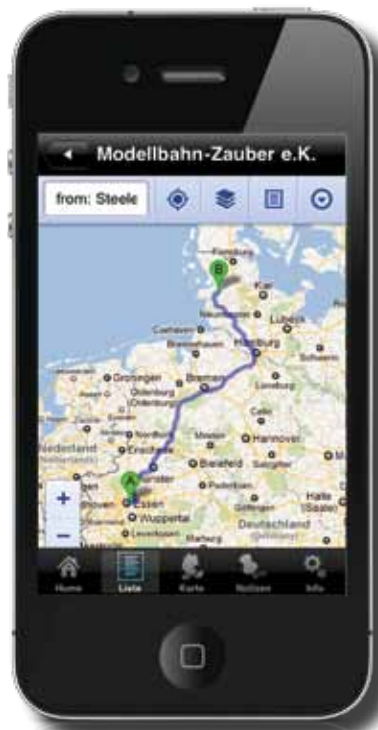
Neu: Möglichkeit der Kfz-Navigation innerhalb der Schauanlagen-App

richtungen die Möglichkeit bieten, Gäste das Fahrgerät in die Hand nehmen zu lassen oder – auf Nachfrage – sogar das eigene Modell mitzubringen. Als LGB-Fan könnte man zusätzlich bei Baugröße „IIm“ auswählen. So erfährt man, dass von den zuvor gefundenen 18 Einrichtungen sieben die LGB-typische Baugröße IIm einsetzen.